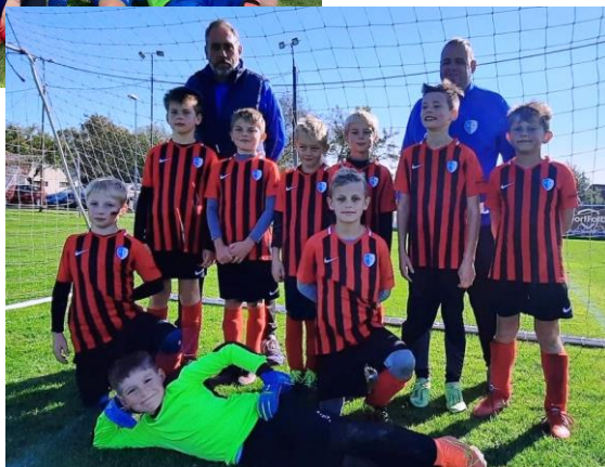
starší přípravka ▶