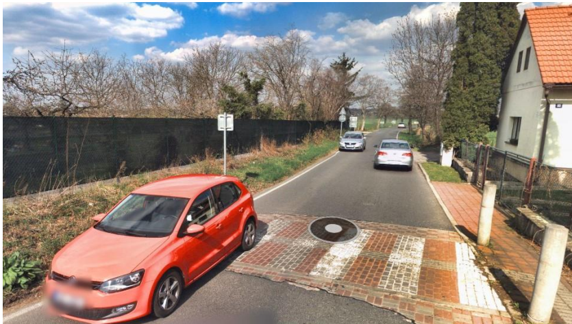
▲ Benická ulice před realizací chodníku... ▼ ... a její podoba dnes.

českého kraje (nikoli obce), a dále tím, že pro samotnou výstavbu bylo potřeba na nezbytně nutnou dobu zcela uzavřít část ulice Benické pro veškerý provoz v obou směrech a pro toto období vyjednat objízdňé trasy (mj. i pro autobusy veřejné dopravy).