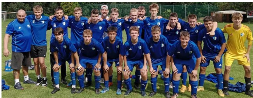
▲ soustředění ve Štěpánovicích

V termínu 26. až 30. srpna jsme vyrazili na soustředění do krásného areálu ve Štěpánovicích u Třeboně. Bohužel jsme si vybrali nejhorších pět dní z celých prázdnin, takže v permanenci byly šušťákové bundy a tepláky. I tak se soustředění povedlo, kluci všechno poctivě odtrénovali a opět jsme utužili partu (třeba týmovým zpěvem ☺).