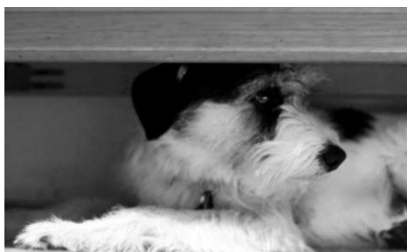
Zaběhne-li se v šoku pes, již se nemusí vrátit. Uvnitř hledá úkryt, třese se strachem.