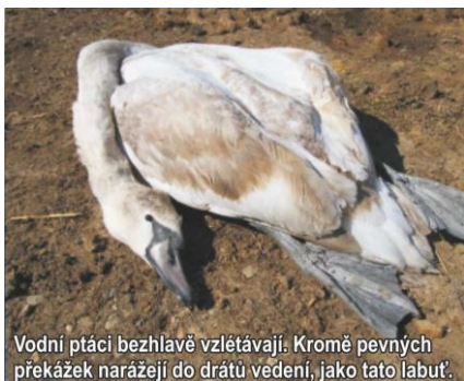
Vodní ptáci bezhlavě vzletávají. Kromě pevných překážek narážejí do drátů vedení, jako tato labuť.