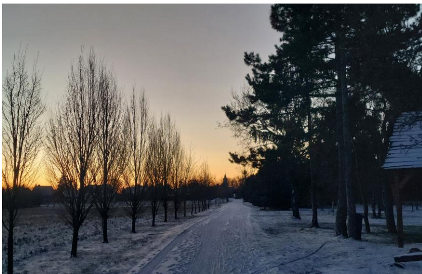
▲ Čestlická in-line dráha v zimní náladě