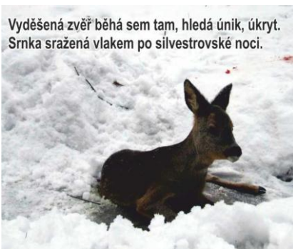
Vyděšená zvěř běhá sem tam, hledá únik, úkryt. Srnka sražená vlakem po silvestrovské noci.