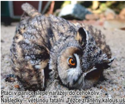
Ptáci v panice slepě narážejí do čehokoliv. Následky – většinou fatální. Těžce zraněný kalous ušá

Platí, že i v naší nové vyhlášce bude výjimka pro silvestrovskou noc. I během ní však prosím jedněte uměřeně. Je ostatně možné, že výhledově dojde k úplnému ukončení prodeje všech druhů a kategorií