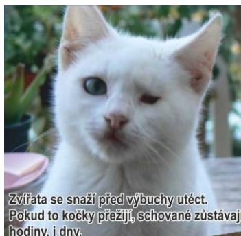
Zvířata se snaží před výbuchy utéct. Pokud to kočky přežijí, schované zůstávají hodiny, i dny.

Nadměrný hluk způsobený zábavní pyrotechnikou představuje pro zvířata utrpení a vyvolává v nich paniku. Typické je to při novoročních oslavách – dávají se na útěk, který ve tmě může končit tragicky. Vydě-