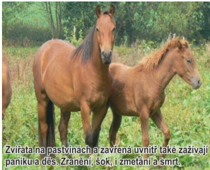
Zvířata na pastvinách a zavřená uvnitř také zažívají paniku a děs. Zranění, šok, i zmetání a smrt.